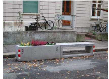
Standardisierte Möblierung (Sitzbank und Pflanztrog) für Begegnungszonen

Eine erste Nachevaluation wird nach Einrichtung von zehn Begegnungszonen vorgenommen. Laufend werden Geschwindigkeitsmessungen und Verkehrsaufkommen in den realisierten Begegnungszonen erhoben und Anliegen der Anwohnenden entgegen genommen. Die Evaluation dient zur Bestimmung notwendiger Nachbesserungen, zur Überprüfung der Eignungskriterien sowie der Akzeptanz der Begegnungszonen für die Bearbeitung der weiteren Begehren.